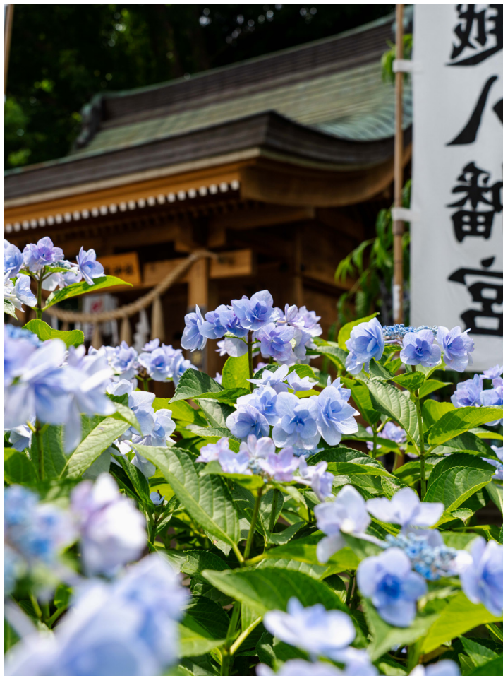
● 東武東上線・JR線 川越駅東口より徒歩7分