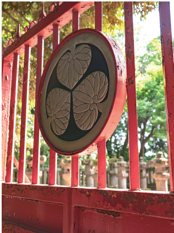
● 東武東上線・埼玉埼京線 川越駅より徒歩19分